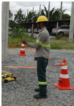
Foto demonstrando o juiz iniciando a contagem do tempo.