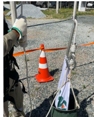
Preparando para içar o balde.