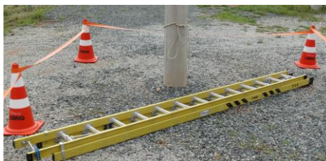
Foto demonstrando a linha de vida amarrada na base do poste