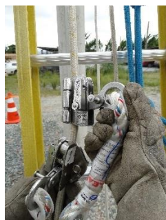
Foto demonstrando dois trava-quedas instalados na mesma linha de vida.