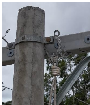
Foto demonstrando a ancoragem da linha de vida na cinta da estrutura