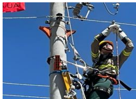
Retirando o grampo do neutro com luva isolante.