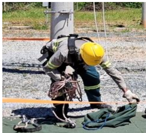
Retirando o conjunto sela e guardando na bolsa.