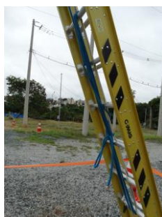
Foto demonstrando a corda de amarração da escada recolhida