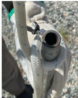
Laçada para içar o suporte com a bandeira para evitar a queda.