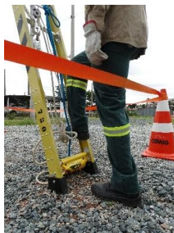
Foto demonstrando o último/primeiro degrau permitido para descida/escalada do eletricista.