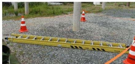
Foto demonstrando a escada no solo