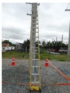
Foto demonstrando a escada recolhida na estrutura