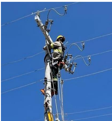
Fotos demonstrando o executante posicionando no degrau de fibra para realização da atividade.