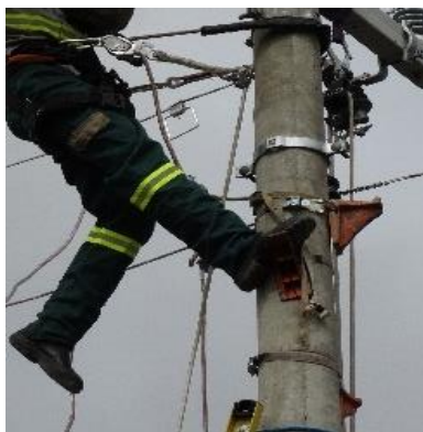
Foto demonstrando o executante posicionado com um pé no degrau

Obs.: O executante durante a atividade poderá ficar com um dos pés fora dos degraus, desde que esteja com o talabarte passado. Não poderá pisar ou posicionar-se sobre ferragens, condutores, longarina da escada para trabalho ou transposição.