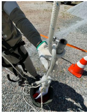
Suporte da bandeira dentro do balde com laçada na haste.