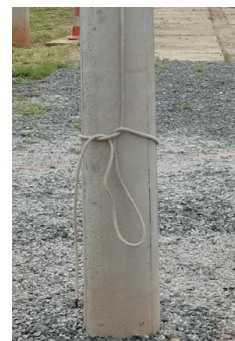
Foto demonstrando a linha de vida amarrada na base do poste