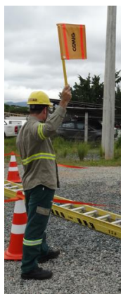
Foto demonstrando o juiz de atividade autorizando o início da tarefa.