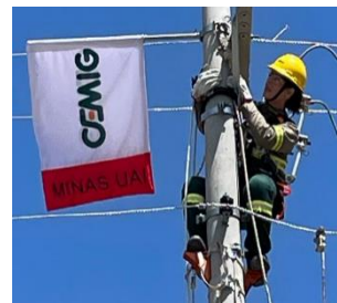
Fotos demonstrando o encaixe da bandeira na cinta.