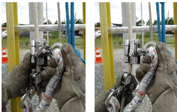
Foto demonstrando o trava-queda travado Foto demonstrando o trava-queda destravado