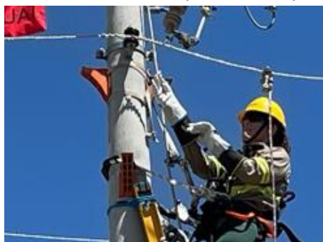
Substituindo a luva de vaqueta pela luva isolante.